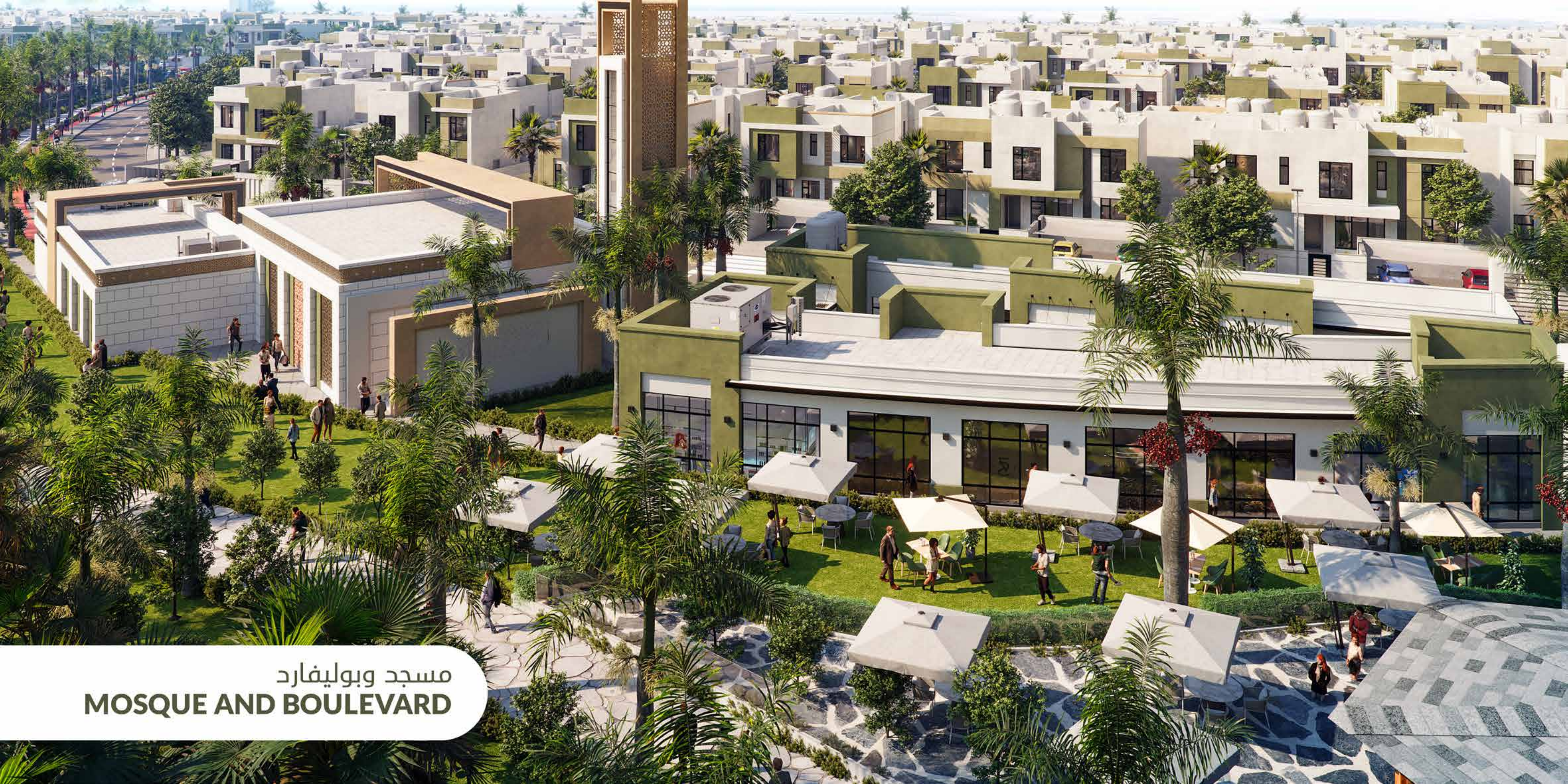
مسجد وبوليفارد MOSQUE AND BOULEVARD